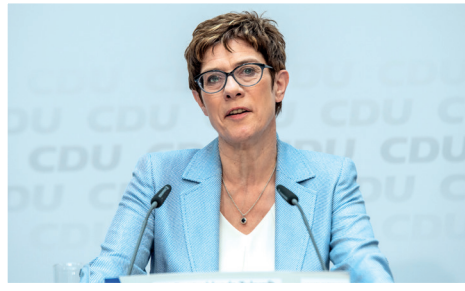
Annegret Kramp-Karrenbauer, seit 2018 Bundesvorsitzende der CDU