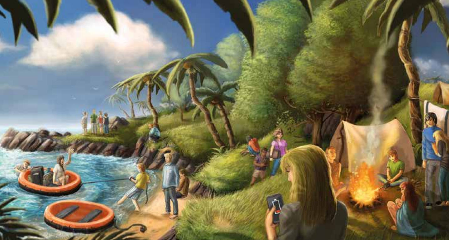
▲ Gestrandet auf einer einsamen Insel - wie baut man eine Gesellschaft auf?